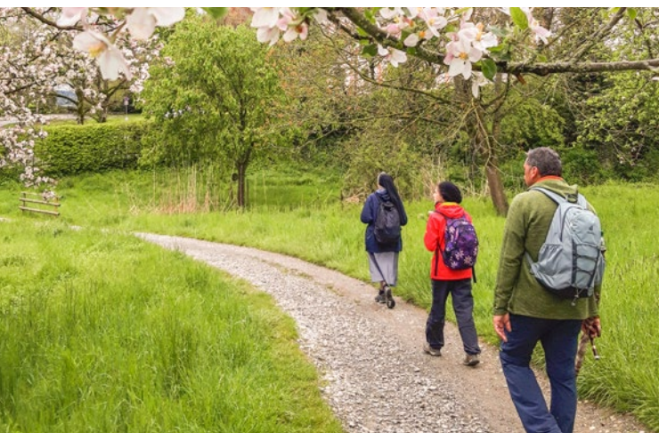
Pilger auf dem Ulrikaweg